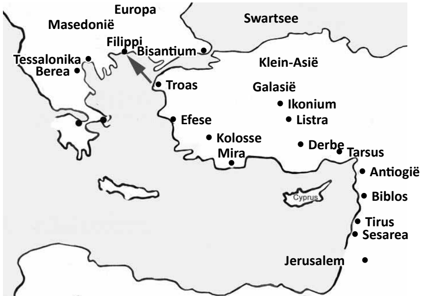
Kaart van antieke Griekeland, Masedonië en Klein-Asië in die tyd van Paulus en die vroeë kerk